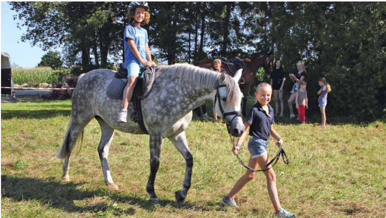
Freudige Gesichter: Beim Ferienprogramm in Fridolfing hatten die Kinder viel Spaß.