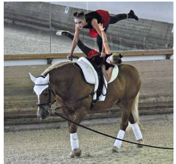
Viel Fantasie: Bunte Kostüme gab es beim Breitensporttag in Giesenbach zu bewundern.