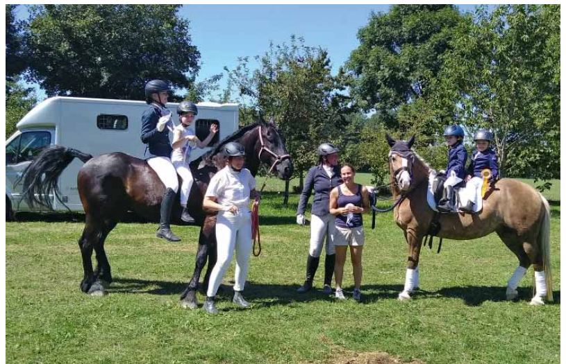
Die Schleifensammler lassen grüßen: Wieder einmal war das Team T-Weichs erfolgreich unterwegs.